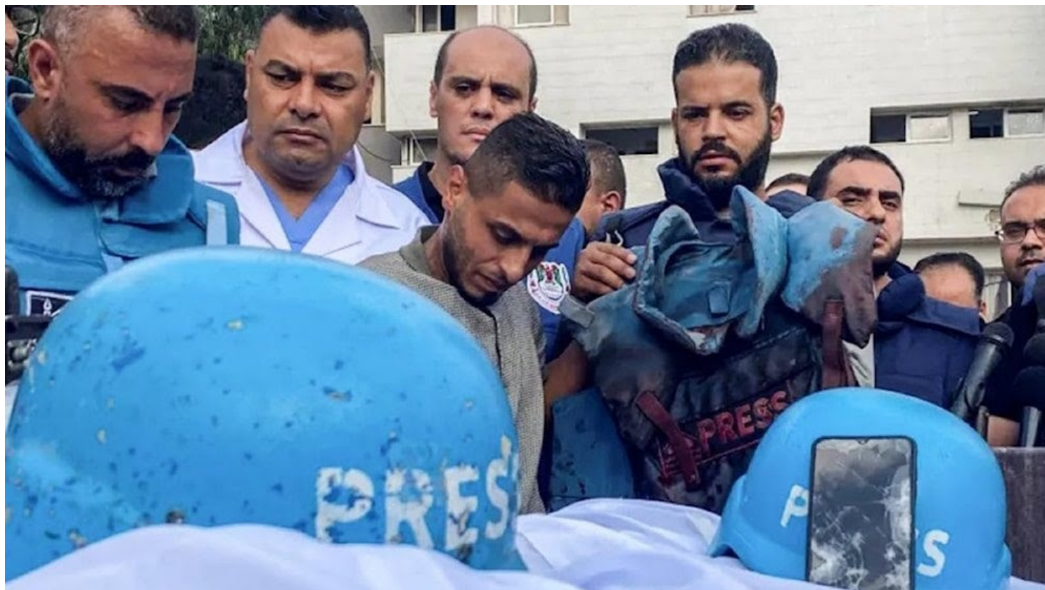
Periodistas y comunicadores voluntarios se han convertido en otro sector de los héroes cotidianos de Gaza.

Nadie puede negar, que los periodistas en Gaza son héroes de nuestro oficio, que arriesgan sus vidas y las de sus familias en condiciones de inmensas dificultades para decir la verdad sobre las condiciones dentro de la Franja