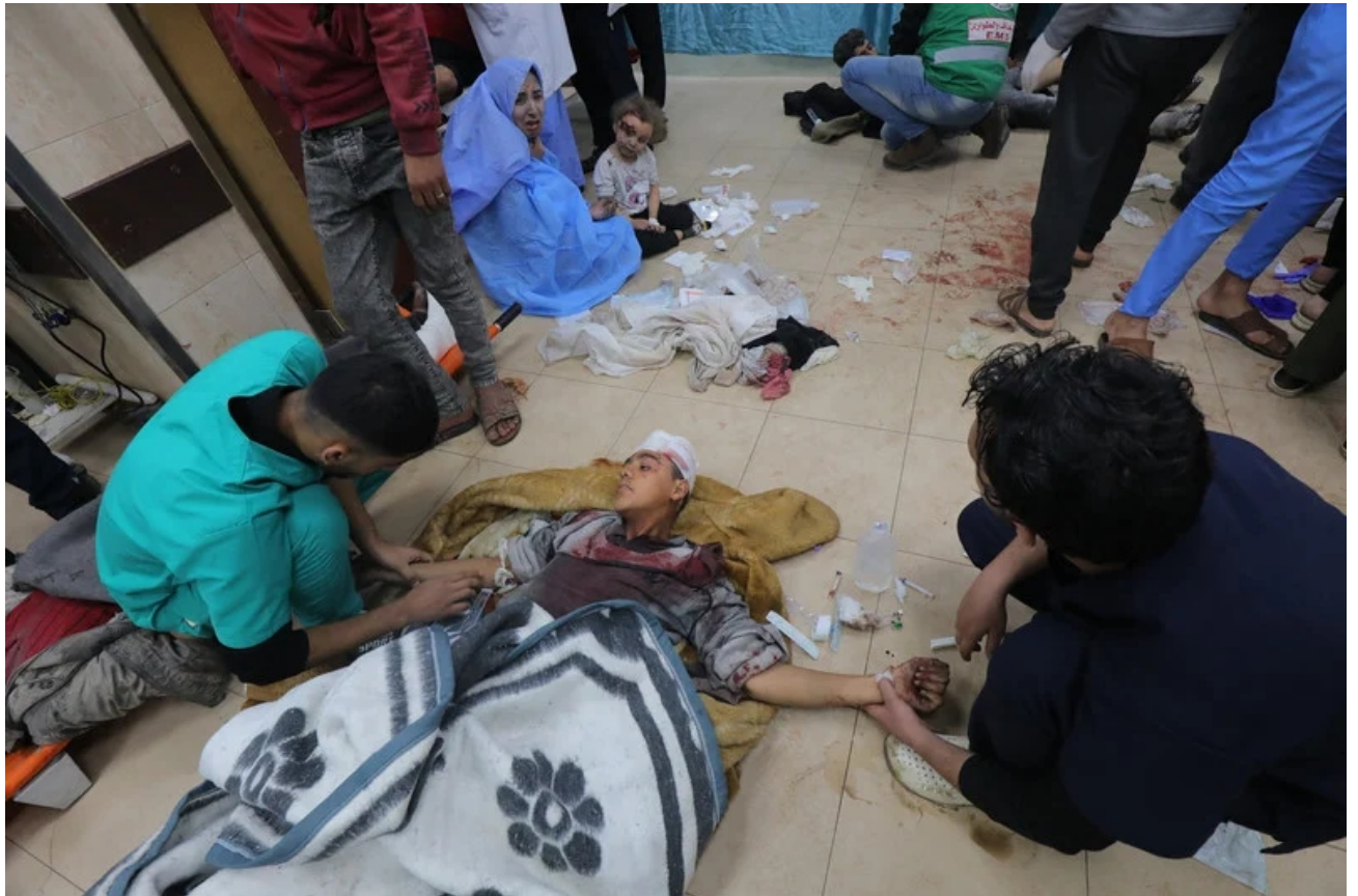
Miles de mujeres embarazadas de Gaza han parido en las peores condiciones.

A esas mujeres se les ha negado atención adecuada y con frecuencia les ha sido imposible asistir a sus citas médicas.