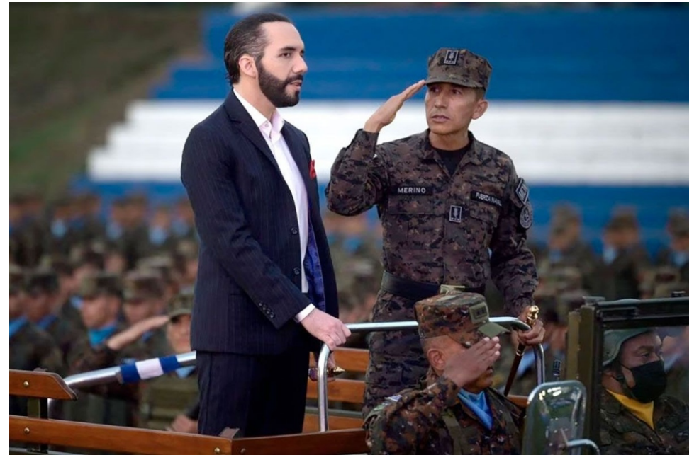
El dictador Bukele y su desprecio por los símbolos.