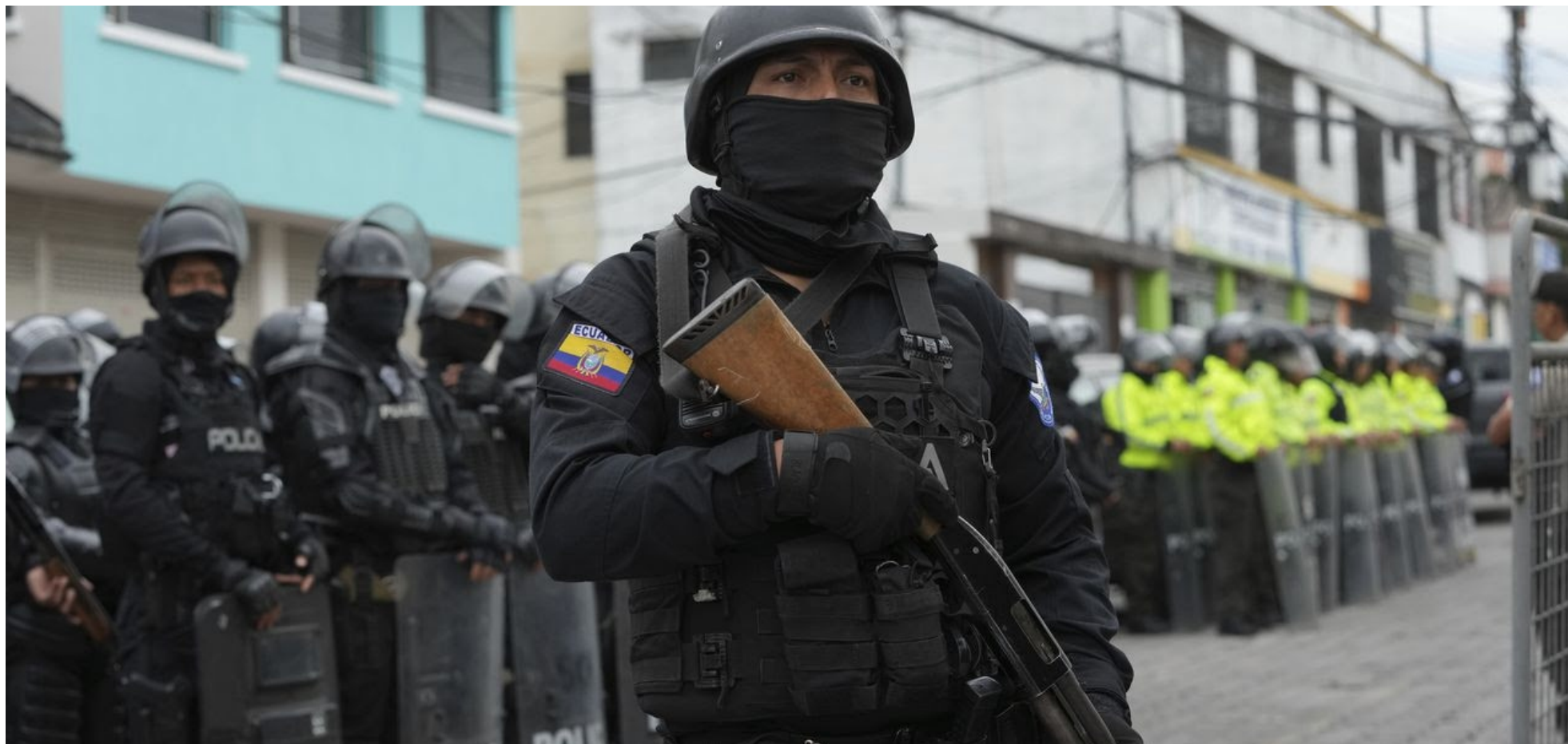
La violencia narco-criminal es destructora, pero entregarle todo el poder de fuego a policías y militares es peligrosa.

Cuando definimos los cuatro vectores principales por los cuales se reproduce el modo de producción imperialista, indicamos que son; la financiarización, el militarismo, la caotización y la narcotización