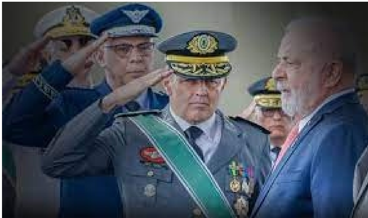
La relación entre Lula y los militares tiende a estar guiada por acuerdos a cambio de gobernabilidad.