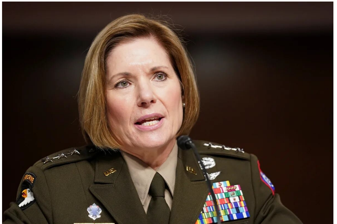
La jefa del Comando Sur, Laura Richardson planta bandera en Ecuador.

Y anuncia el viaje de los funcionarios "para acelerar esa cooperación", pero también para "explorar con los homólogos ecuatorianos formas en que podemos trabajar juntos de manera más efectiva para enfrentar la amenaza que representan las organizaciones criminales transnacionales".