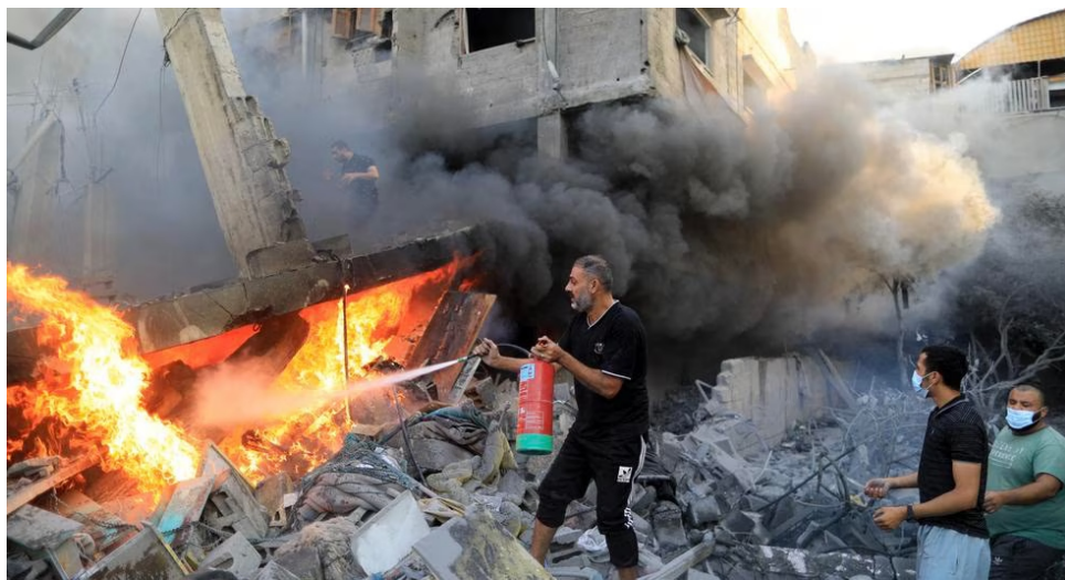
La solidaridad del pueblo de Gaza es indestructible: todos se ayudan entre todos.

El 14 de diciembre se cerró la red de comunicaciones en Gaza.