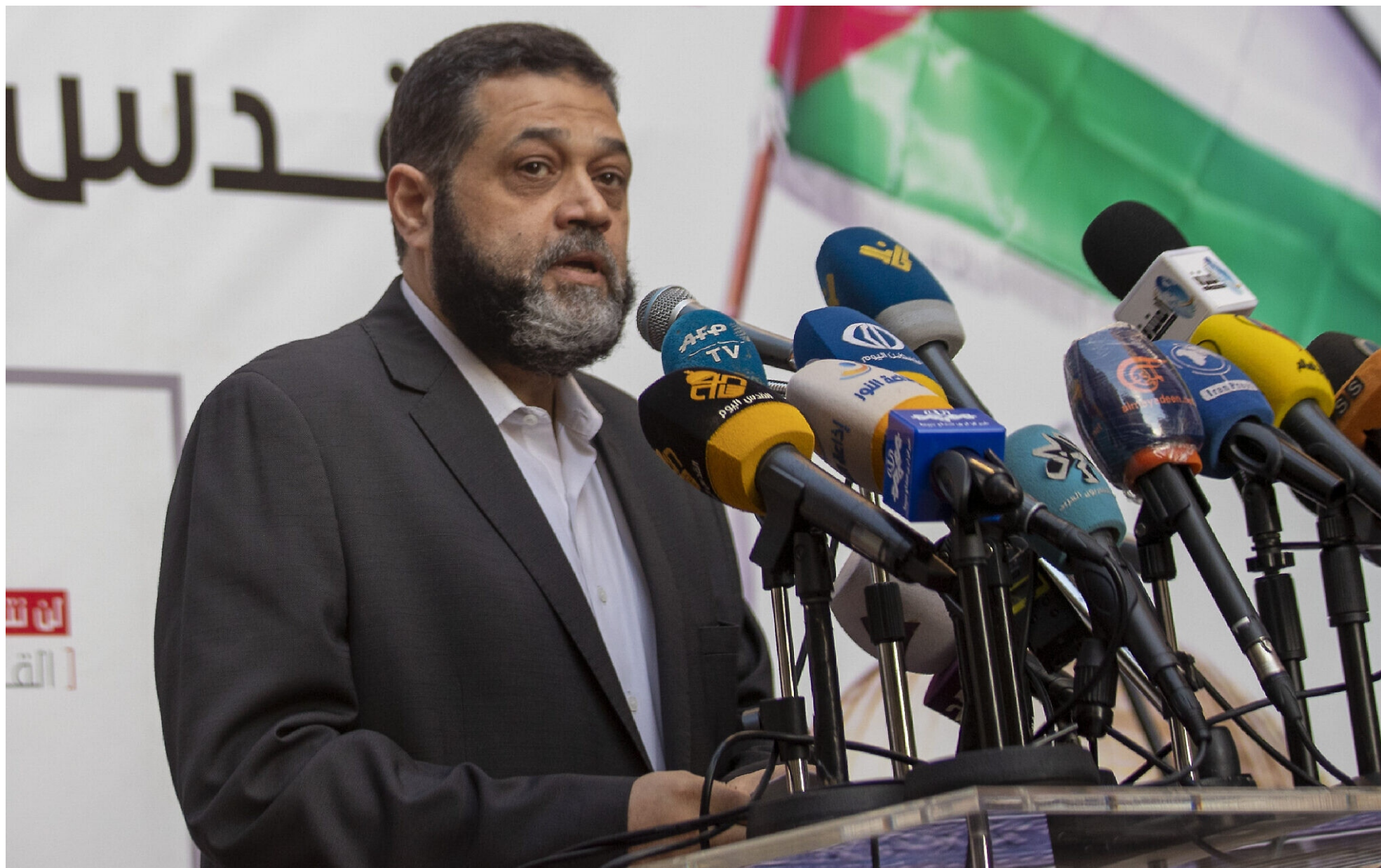
Hamás actúa de hecho como vanguardia reconocida por el resto de la Resistencia palestina.