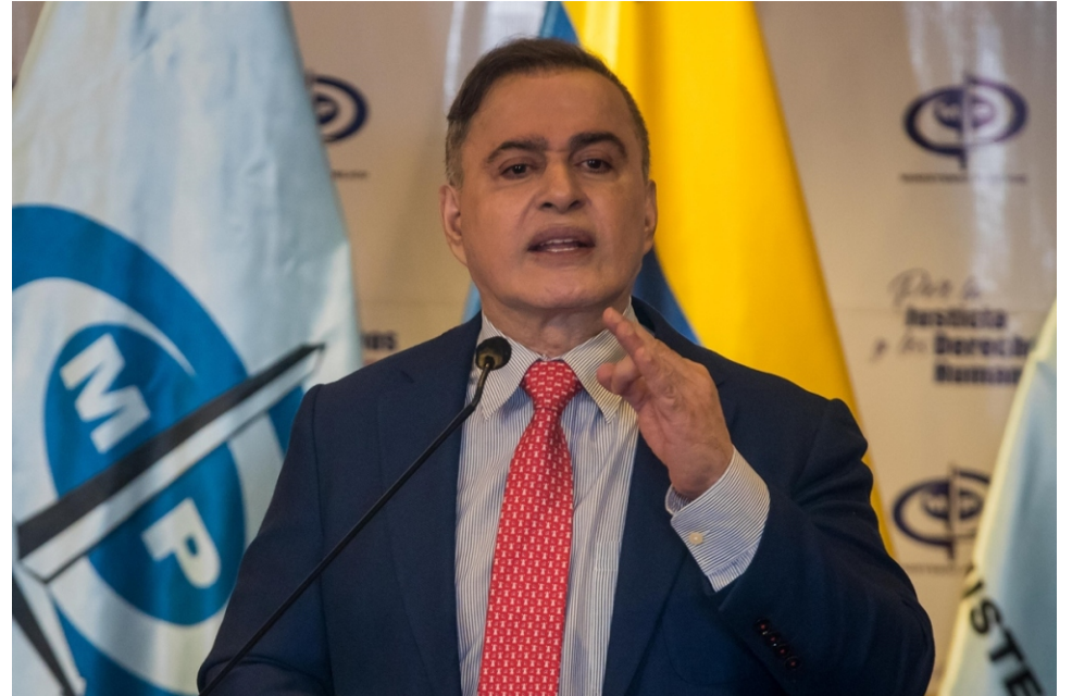
El fiscal general Tarek William Saab arremetió contra nuevas conspiraciones de la derecha.

El Presidente Maduro ya se había referido a las declaraciones de Machado realizadas durante los días del proceso de diálogo, que aludían a posibles rebeliones militares contra Maduro y que, según dijo el presidente, habían provocado una interrupción