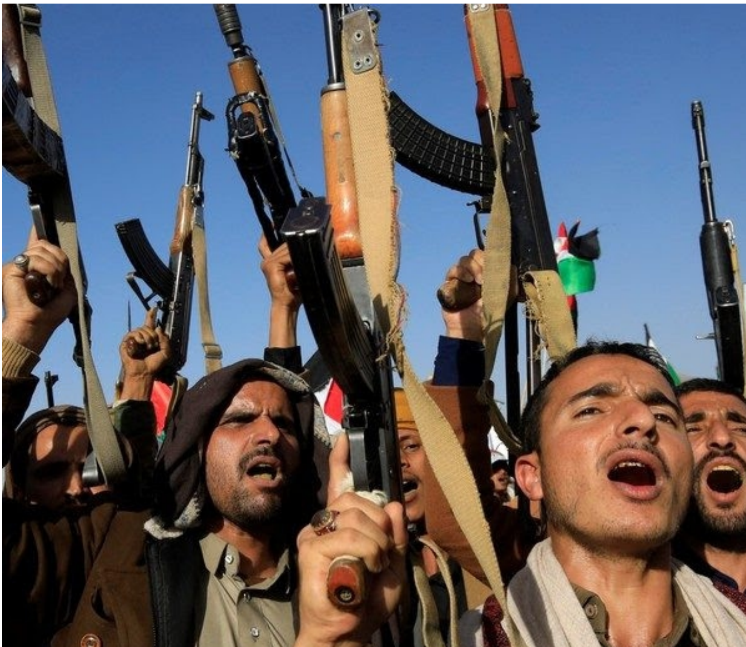
El pueblo revolucionario yemení en defensa de la Palestina ocupada.

Un miembro del movimiento Ansarolá advirtió a Estados Unidos por sus recientes ataques a Yemen, asegurando que tendrá que pagar muy caro por sus crímenes.