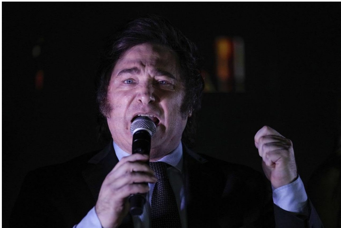
Si faltaba algo para ganarse el premio al gran disparate, Milei corrió por derecha a la gran derecha económica mundial.

Si faltaba algo para corroborar la verdadera condición de Javier Milei, ahora contamos con su "pieza discursiva" en el Foro Davos del 17 de enero de 2024. Pieza tóxica si las hay, sin una pizca de la aristotélica virtud intelectual. Una pieza dogmática que quiere poner la vida al servicio de una teoría menesterosa y antidialéctica. Una verdadera "diatriba" contra los costados menos salvajes del capitalismo. La pieza, perfectamente, podría titularse: el capitalismo será salvaje o no será.